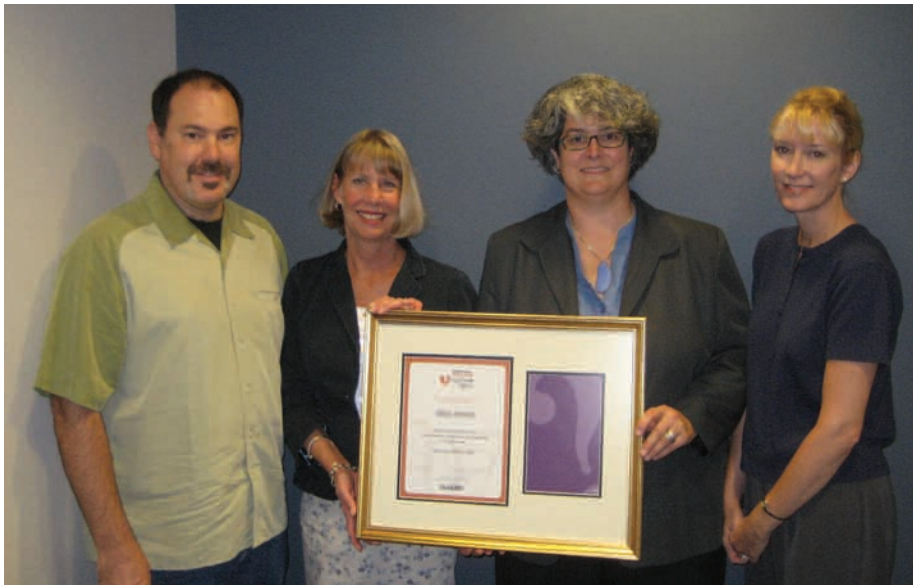
Opposite page: The discreet cover of the English edition of Pregnancy and Parenting and pages 34–35 from that edition. This page: Left, recipients of the Magnum Opus Award; below, the Pregnancy and Parenting cover and pages 34–35 in the Spanish edition. Graphics were colorful and well suited to the format of the text—in this case, questions and answers.